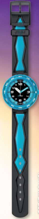
GET IT IN BLUE! ZFCSP016