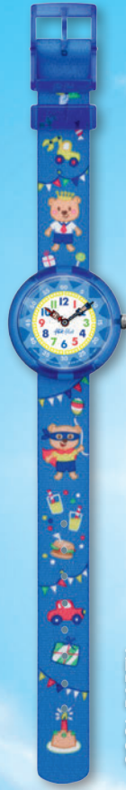
COOL PARTY ZFBNP086