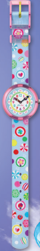
SUGAR BUNCHY ZFBNP064