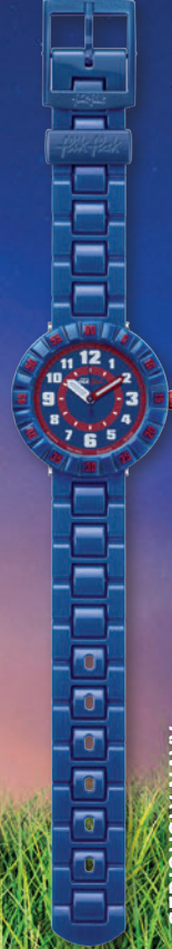
SERIOUSLY NAVY ZFCSP040