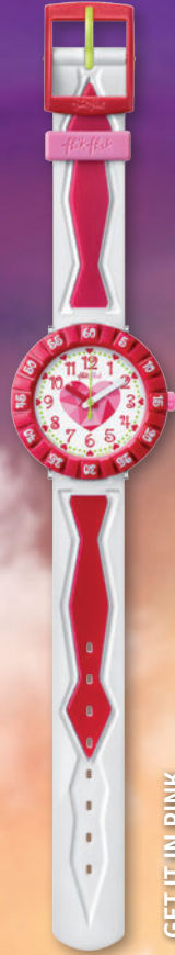
GET IT IN PINK ZFCSP036