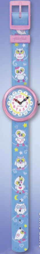
CUTE OWLS ZFBNP063