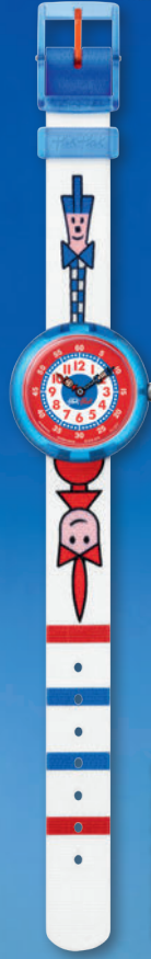
TICKING RIGHT ZFBNP079