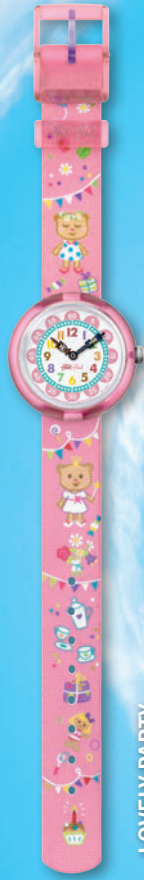
LOVELY PARTY ZFBNP083