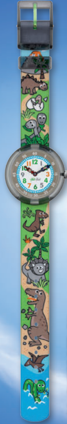
SAURUSES RETURN ZFBNP048