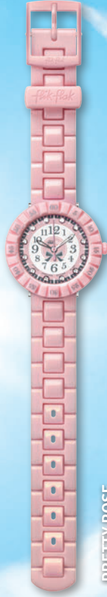
PRETTY ROSE ZFCSP047