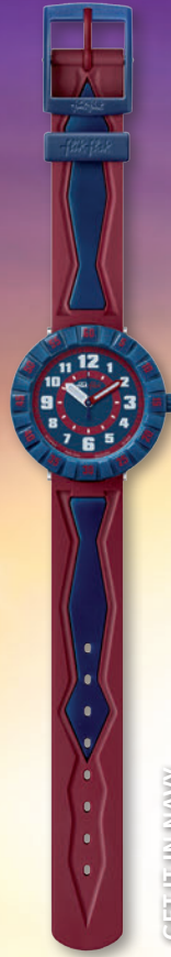
GET IT IN NAVY ZFCSP038