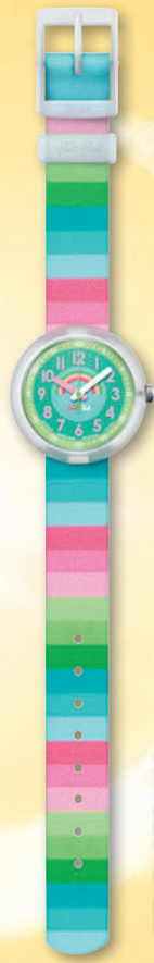
STRIPY DREAMS ZFBNP014