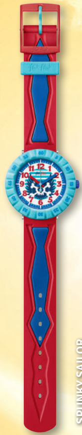
SPUNKY SAILOR ZF CSP051