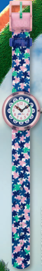
LONDON FLOWER ZFBNP080