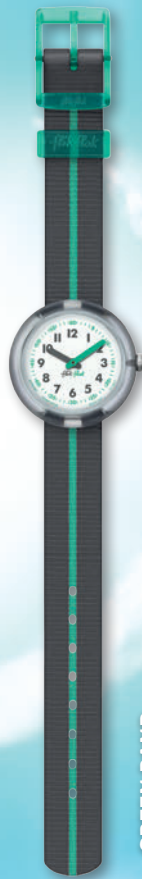
GREEN BAND ZFPNP022