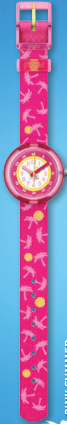
PINK SUMMER ZFPNP010