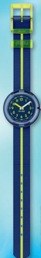
YELLOW BAND ZFPNP023