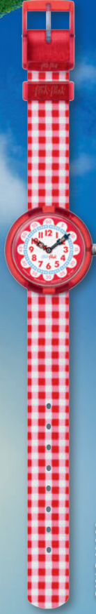
GING HAM ZFBNP078