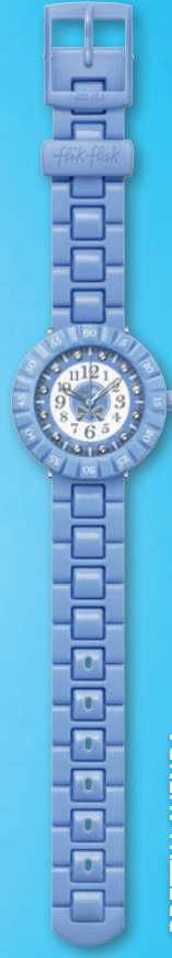
PRETTY LAVENDA ZFCSP048