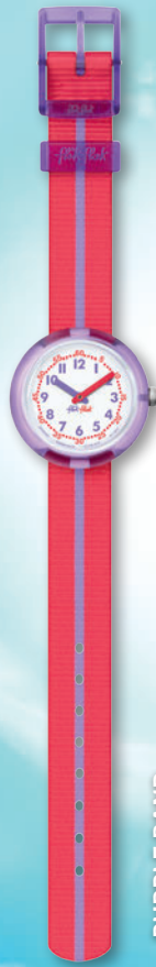
PURPLE BAND ZFPNP021