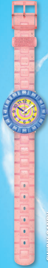
SWIRLY CANDY ZFCSP045