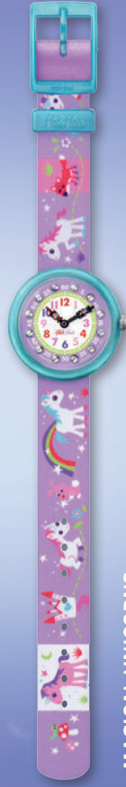
MAGICAL UNICORNS ZFBNP033