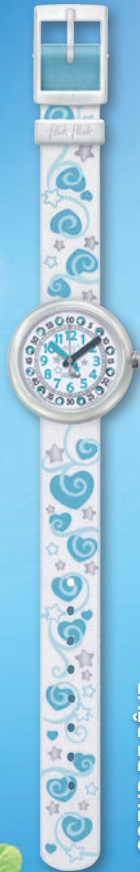
COEUR DE RÊVE ZFTNP005-STD