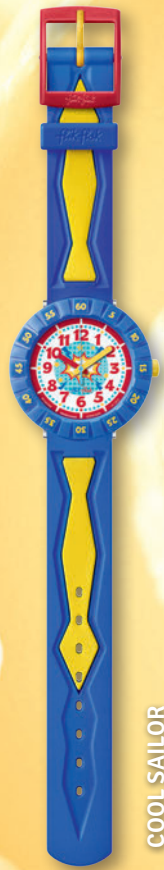
COOL SAILOR ZF CSP050