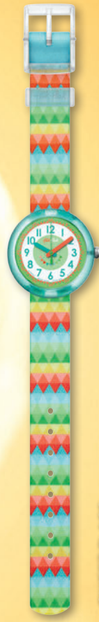
SWEET FLAGS ZFBNP015