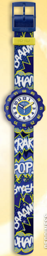
PEPPINESS ZF PSP013