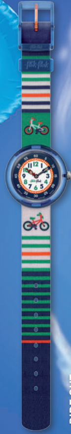
RIDE OUT ZFBNP067