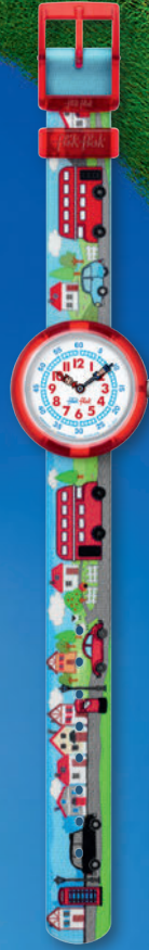
HIGHWAY TO UK ZFBNP077