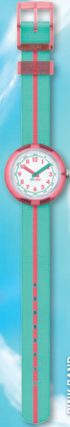
PINK BAND ZFPNP020