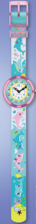
SPLASHY DOLPHINS ZFBNP035