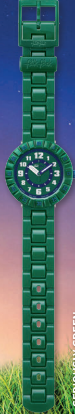
SERIOUSLY GREEN ZFCSP039