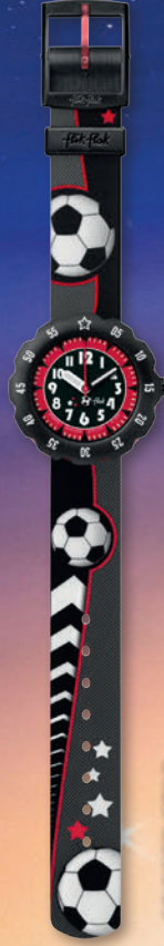
SOCCER STAR ZFPSP010