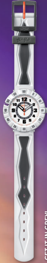
GET IT IN GREY! ZFCSP037