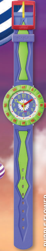
PURPLE FLOWER ZFCSP035