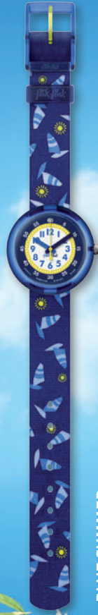
BLUE SUMMER ZFPNP011